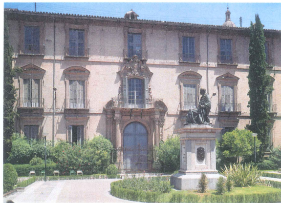
Vista exterior del palacio episcopal de Murcia , edificio en el que se dio más importancia a la funcionalidad que a la decoración.

Se construyeron numerosos edificios, entre los que destacan el palacio episcopal y los palacios de los Fontes y de las Balsas , en la ciudad de Murcia; las reformas urbanas de Cartagena y sus fortificaciones; el Ayuntamiento de Caravaca; el castillo de San Juan de Águilas y el palacio de los Fajardo , en Cehegín.